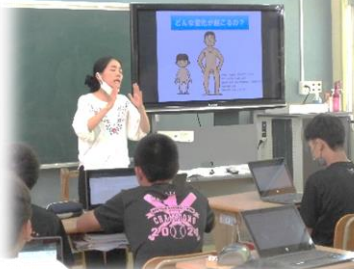
男女に分かれて 体の成長について学 習しました。 6年