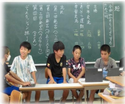
パネルディスカッション 6年