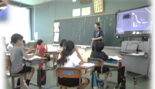
登場人物の気持ちの変化は？ 3年