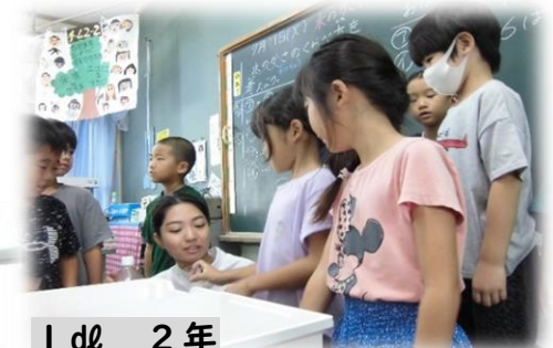
1dl 2年 実際に水をはかって確認