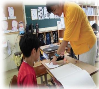
協力して片付け 1年生