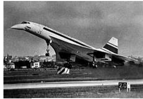
音より早い飛行機