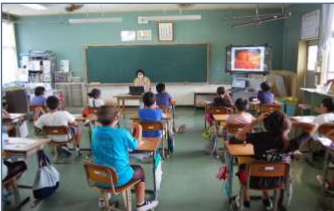
4年1組さんの授業風景 ↑

保護者の皆様が小学生の頃は、おそらく保健体育の授業は5、6年生で行ったと思います。今は3年生から保健体育の授業があります。子ども達の体の発育や心の発達、大人になるための大切な知識となるものです。ご家庭でも正しい知識や思いやりの心について、適宜話し合ってみてください。