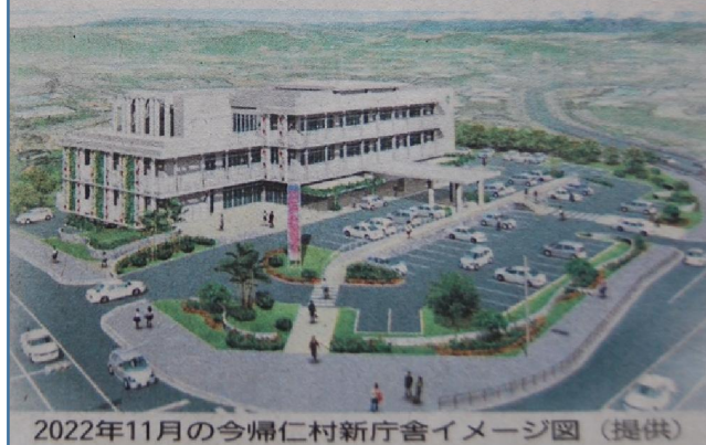
2022年11月の今帰仁村新庁舎イメージ図（提供）

ご存じだと思いますが、先日、新聞に今帰仁村役場新庁舎着工の記事がありましたのでご紹介させていただきます。